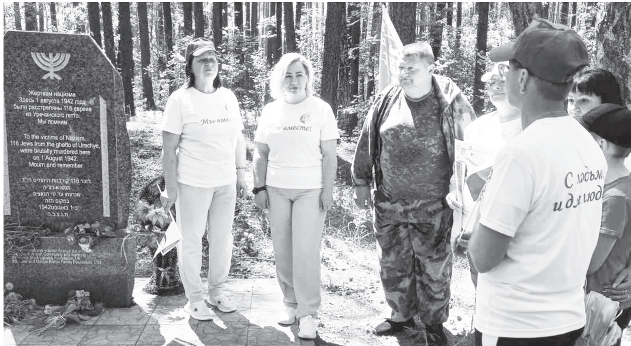
Память жертв геноцида почтили минутой молчания.