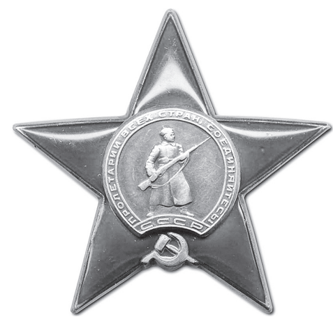
Орден Красной Звезды за отвагу.