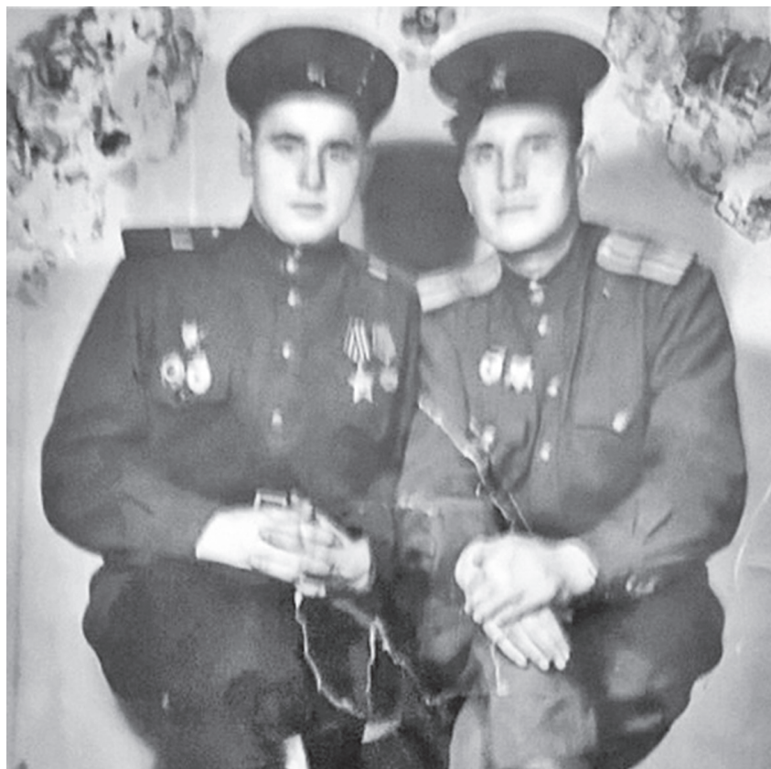
Они сражались за Родину.