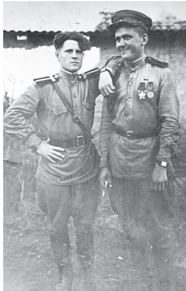
Наш зямляк з таварышам-вайскоўцам.