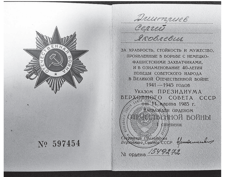
Орден Айчыннай вайны за вытрымку і адвагу ў гады ліхалецця.