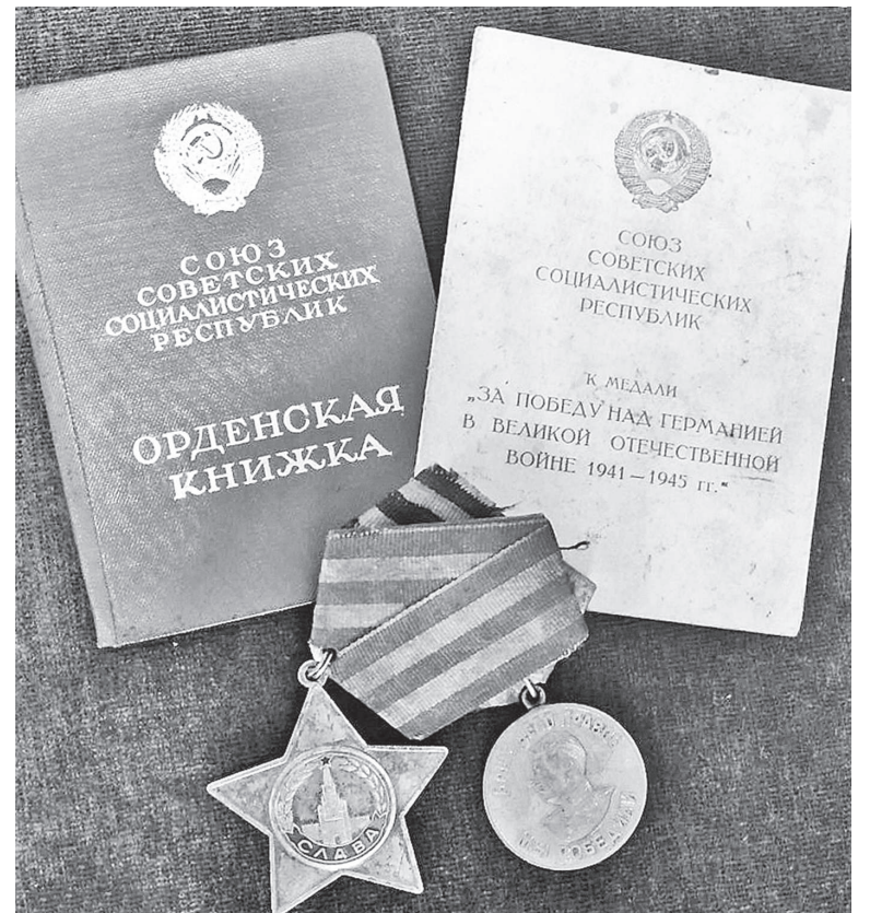
За кожнай узнагародай – гераізм і стойкасць.