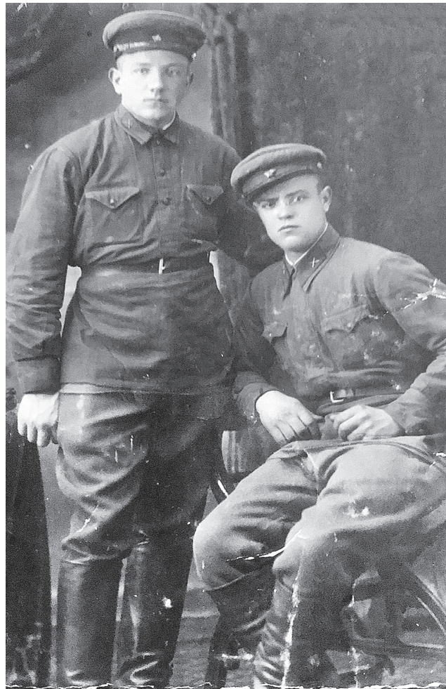
Наш зямляк (злева) прайшоў гераічны шлях і спаўна выканаў свой грамадзянскі абавязак перад Радзімай.

Але доўга не змог трымаць абарону. Хутка яго, абясціленага, схпілі фашысты і ўчынілі зверскую расправу. Здэкаваліся з яго, ды не спалохалі мужанага чырвонаармейца: ён не