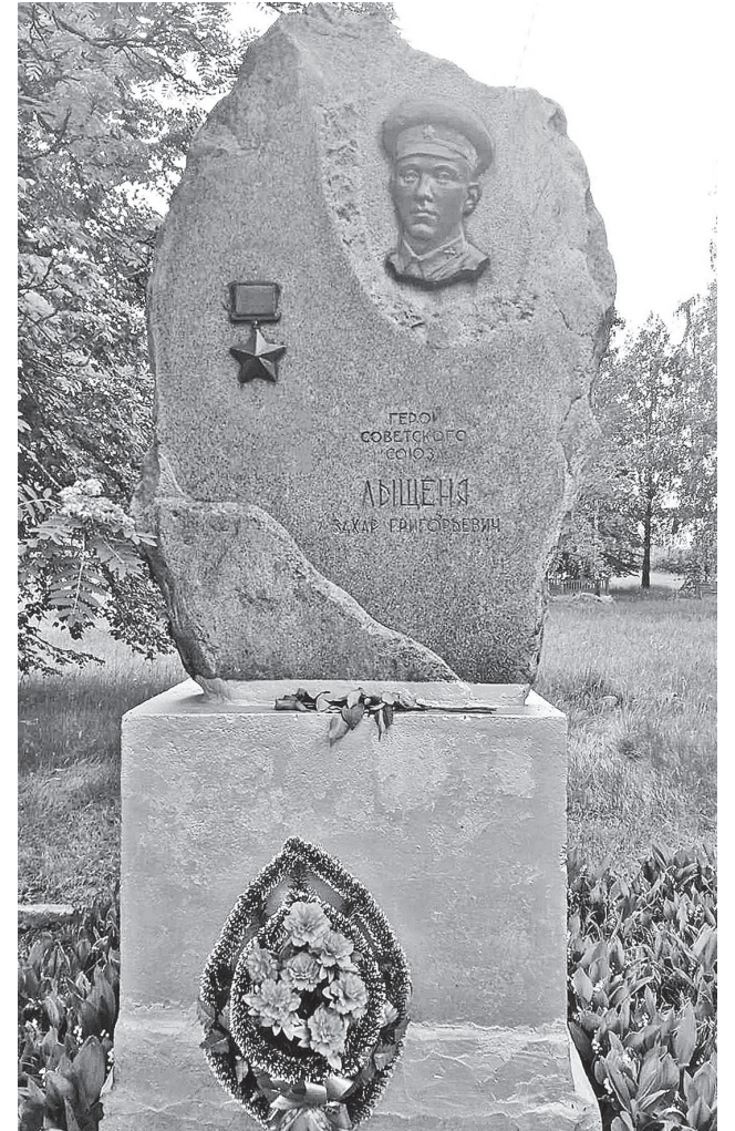
Не зарастае сцяжынка да помніка Захару Лышчэні, устаноўленаму ў в. Пласток.

быў вызвалены ад гітлераўцаў, баявыя таварышы знайшлі свайго камандзіра і годна яго пахавалі. А пасля ліхалецця Указам Прэзідыума Вярхоўнага